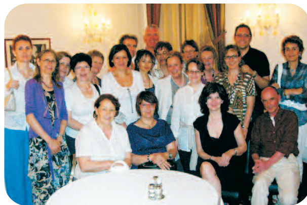
Nella foto: i partecipanti

... 24 giugno a Udine, incontro pizza "per stare in compagnia" con i partecipanti ai corsi di psicoeducazione.