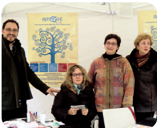
Nella foto: volontarie e medici insieme in piazza

❖ 24 Ottobre a Pordenone, Giornata di sensibilizzazione sulle Malattie Reumatiche.